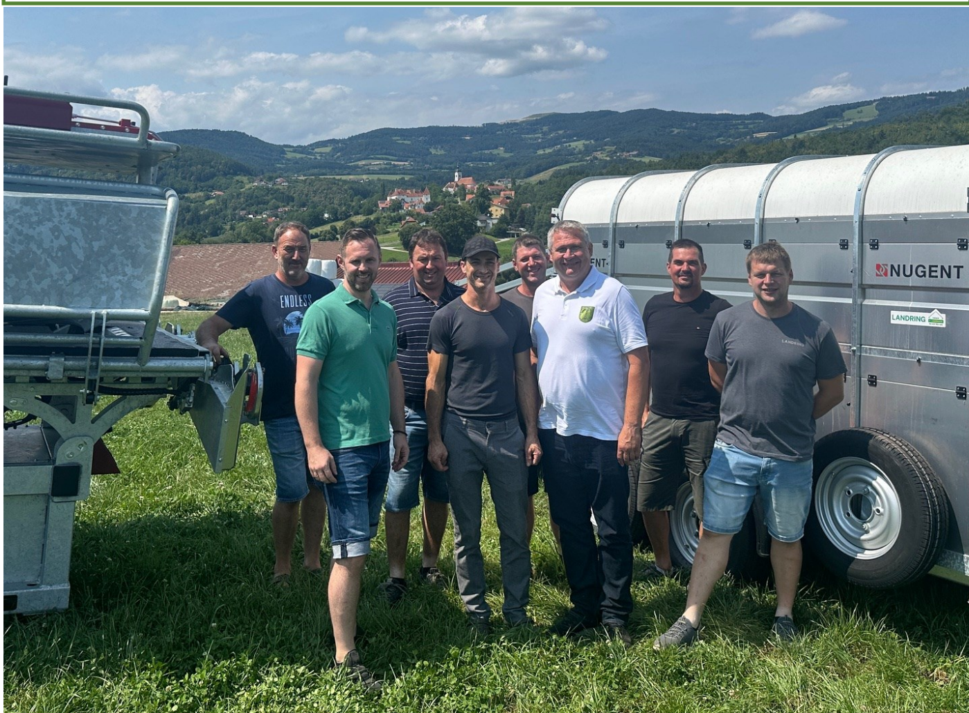
Die Fleckviehzuchtgenossenschaft Stubenberg am See wurde durch die Gemeinde Stubenberg beim Ankauf eines neuen Viehanhängers und eines Kuhklauenstandes unterstützt.

Im ersten Schritt werden nur Rechnungen und die Vorschreibung elektronisch ausgesickt.